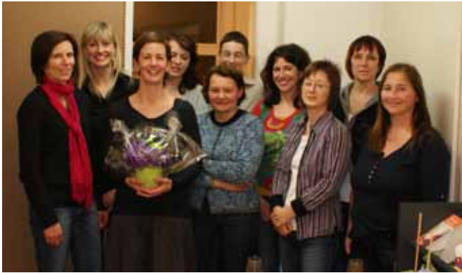
Frau Holle: Koordinatorinnen bei der Teamsitzung