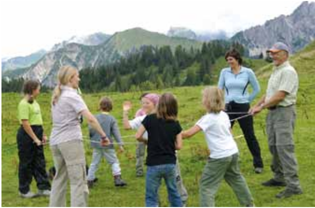
Biosphärenpark als Urlaubsziel