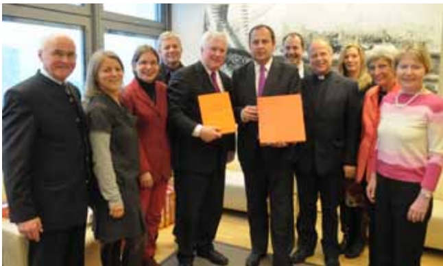
15.12. Präsidium des Katholischen Familienverbandes Österreich bei Finanzminister Josef Pröll in Wien.