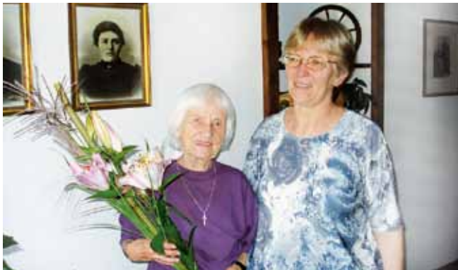
Wolfurt: Besuch Ehrenmitglieder zum Geburtstag