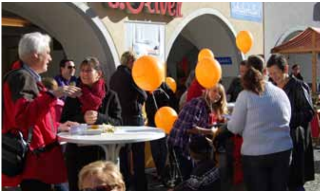
13.11. Aktionstag in Feldkirch