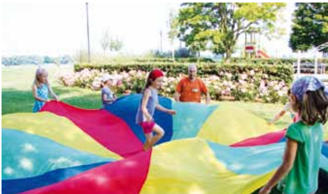
Hard: Spiel mit dem Schwungtuch