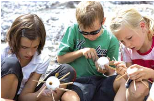
Bastelspaß am Wasser