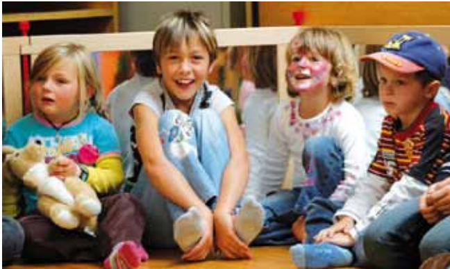
Dornbirner Messe: Spiel und Spaß im Kinderlände