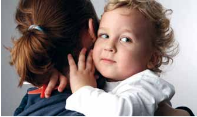
Begleitkosten gesenkt, deutliche Verbesserung für Familien.