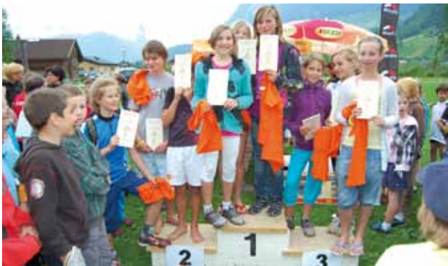
Schoppernau: Kindertriathlon Siegerehrung