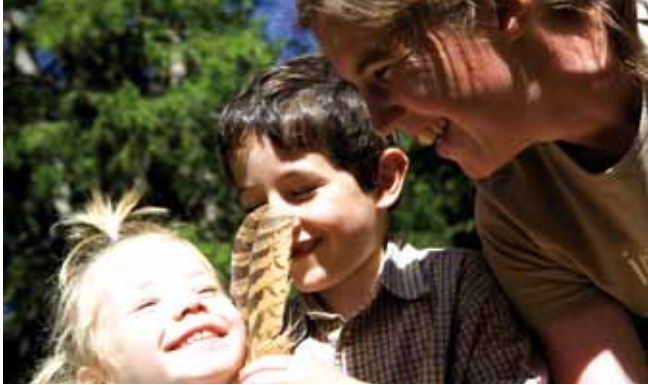
Walderlebnistage für Familien