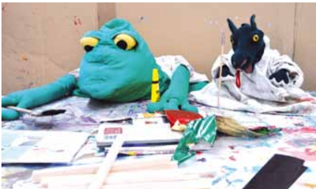
Familienstag im Kunsthaus