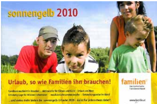
Broschüre sonnengelb - Herausgegeben vom Katholischen Familienverband Österreich (KFÖ)