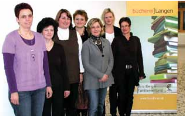
Langen bei Bregenz: Team