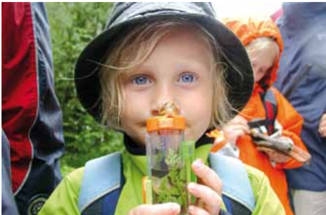
Kleine Forscher unterwegs