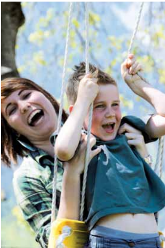
Frau Holle: Stundenweise Kinderbetreuung