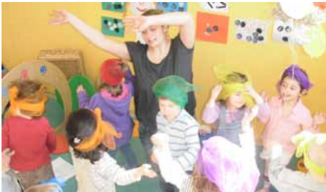
Lustenau: Kinderbetreuung im SPAZI