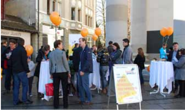
13.11. Aktionstag in Dornbirn