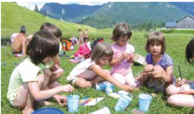
Bezau: Große Malaktion in Schönebach