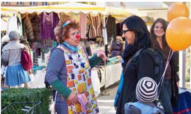
13.11. Aktionstag in Bregenz